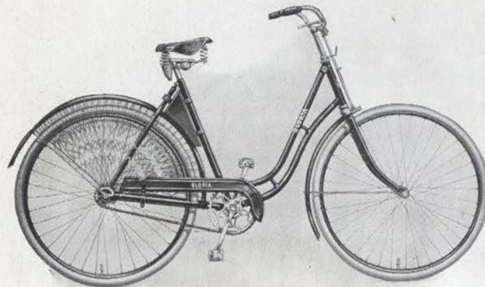
Gloria-Damenrad elegant und zuverlässig, für den guten Geschmack

Rahmen Innenlötung, bestes Tauchbadverfahren, aus 1a nahtlos gezogenen Stahlrohren. Höhe bei Herren 55 oder 60 cm, bei Damen 55 cm. Emallierung tiefschwarz, hochglänzend, mit doppelten Linien abgesetzt. Gabelkopf abgerundet, vernickelt. Lenkstange englische Form mit kurzem Vorbau und Hebelbremse. Tretlager Doppelglockenlager. Kettenrad 48 Zähne 1/2 " Teilung, Innengewinde, auf Kurbel aufgeschraubt. Kurbeln Vierkantbefestigung. Laufträder Stahlfelgen für Wulstreifen 28 \times 1\frac{1}{2} ", schwarz emalliert mit grünem Mittelstreifen und Goldlinien, auf Wunsch holzfarbig emalliert mit schwarzen Strichen. Kette 1/2 \times 1/8 ". Pedale mit Gummieinlage. Sattel mit vernickelten Druck- und Zugfedern, gelbes Leder. Werkzeugtasche gelbes Leder, mit Werkzeugschlüssel und Oelkännchen.