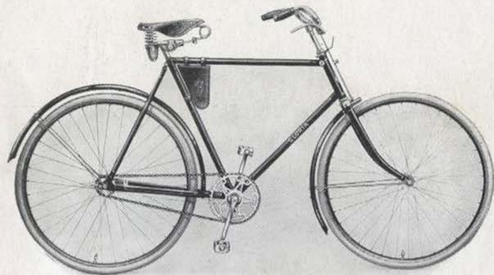
Gloria-Herren-Tourenrad die preiswerte und schnittige Gebrauchsmaschine

Rahmen Innenlötung, bestes Tauchbadverfahren, aus 1a nahtlos gezogenen Stahlrohren. Höhe bei Herren 55 oder 60 cm, bei Damen 55 cm. Emallierung tiefschwarz, hochglänzend, mit doppelten Linien abgesetzt. Gabelkopf abgerundet, vernickelt. Lenkstange englische Form mit kurzem Vorbau und Hebelbremse. Tretlager Doppelglockenlager. Kettenrad 48 Zähne 1/2 " Teilung, Innengewinde, auf Kurbel aufgeschraubt. Kurbeln Vierkantbefestigung. Laufträder Stahlfelgen für Wulstreifen 28 \times 1\frac{1}{2} ", schwarz emalliert mit grünem Mittelstreifen und Goldlinien, auf Wunsch holzfarbig emalliert mit schwarzen Strichen. Kette 1/2 \times 1/8 ". Pedale mit Gummieinlage. Sattel mit vernickelten Druck- und Zugfedern, gelbes Leder. Werkzeugtasche gelbes Leder, mit Werkzeugschlüssel und Oelkännchen.